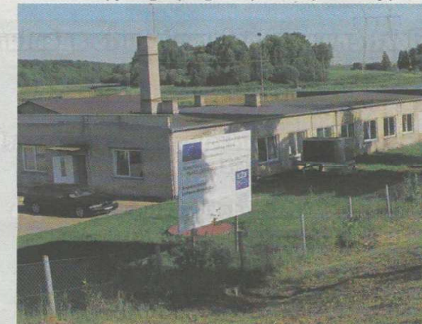
ŽT Žuvivaisos skyriaus Laukystos poskyris