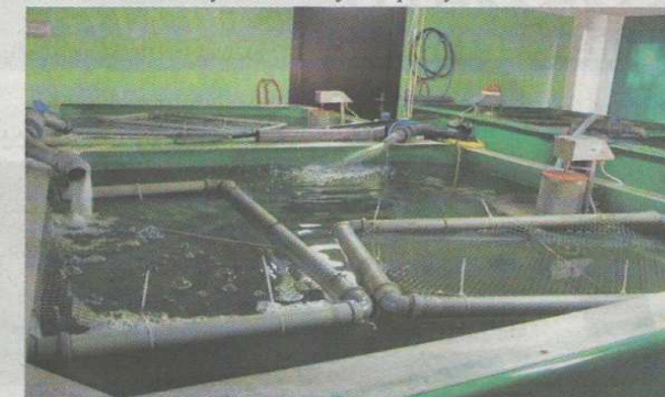
Šiuose baseinuose ŽT Žuvivaisos skyriaus Laukystos poskyryje auginami unguriukai